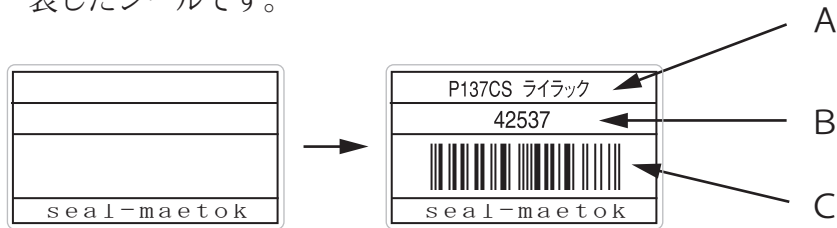
*エクセルデータ見本*

*ファイル管理や収納管理、営業所名、商品番号などを文字やバーコードで表したシールです。