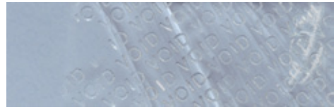
剥がして貼った状態 表面に開封済（VOID）の文字が 見えます