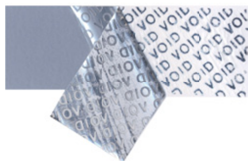
改ざん防止シール英文（VOID）