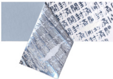
改ざん防止シール和文（開封済）